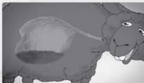
Om het voer nog verder af te breken spuugt het schaap kleine deeltjes uit. Dan kauwt hij het nog eens, met heel veel spug, en dan slikt hij het opnieuw door.