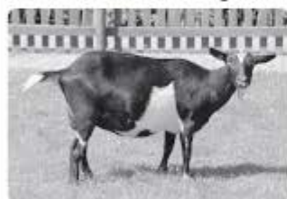
Nederlandse bonte geit

De melkgeit werd ook wel de koe van de armen genoemd. Geeft ongeveer 500 liter melk per jaar.