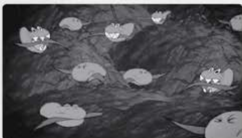
In de pens wordt het voer door miljoenen bacteriën afgebroken. Dat zijn speciale, goede bacteriën.