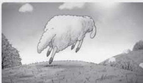
Kracht en energie uit hooi en gras. Ja, schaapjes, dat hebben jullie slim bekeken.