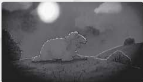
Het kan wel anderhalf of twee dagen duren voordat het voer zo sappig is dat het verteerd kan worden.