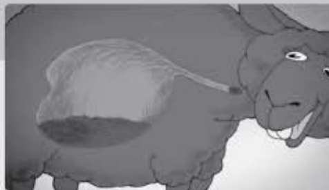
Daarom hebben herkauwers zoals schapen een extra maag, de pens. Die dient als een tijdelijke opslagruimte.