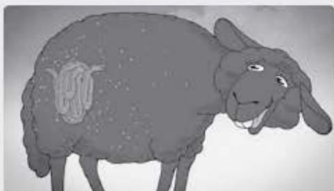
Via de darmen komen de voedingsstoffen in hun bloed terecht en zo worden ze door hun hele lijf verspreid.