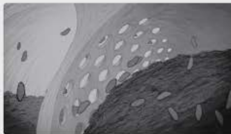
Nadat de bacteriën het voer hebben afgebroken, vinden de voedingsstoffen uit het groen hun weg naar de darmen.