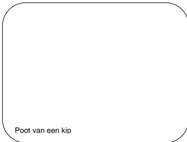
Poot van een kip