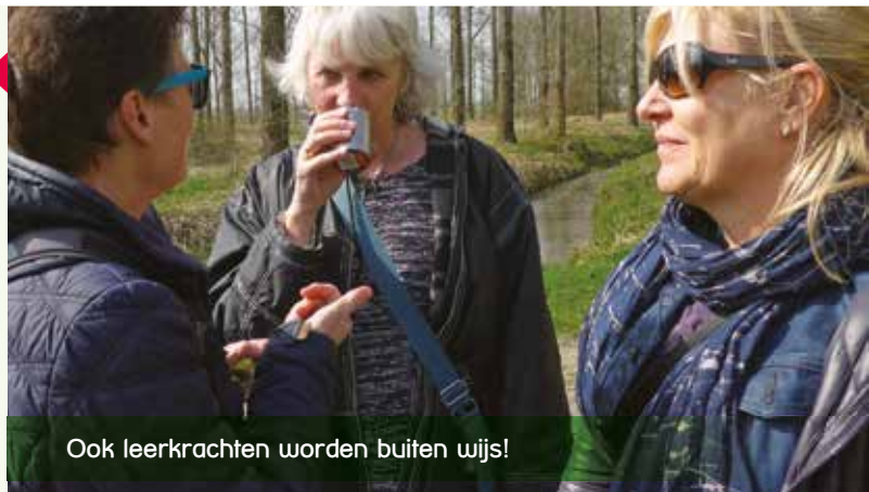
Ook leerkrachten worden buiten wijs!

Samen met enkele vrijwilligers zijn leerkrachten op mooie locaties in elke gemeente geschoold in 'buitenwerk', zodat zij handvatten kregen om gemakkelijker met hun leerlingen buiten actief te kunnen zijn. Het buitenwerk bestond uit verschillende activiteiten: het herkennen van een boomblad, een geblijndoekte collega begeleiden over een bruggetje, muziek van vogels beschrijven en een parfum maken met materialen uit de natuur. Met heel veel plezier hebben de leerkrachten de opdrachten uitgevoerd.