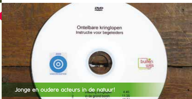
Jonge en oudere acteurs in de natuur!

Deze buitenles is een moeilijke les voor onze vrijwilligers. een les op niveau! Het vraagt meer kennis en vaardigheden dan bij de andere lessen. Omdat het draaiboek niet voor alle vrijwilligers toereikend was, is er een film gemaakt hoe deze les er mogelijk uit zou kunnen zien. Deze film is op DVD gezet en is aan alle vrijwilligers uitgereikt. De kinderen die meededen in de film speelden als echte acteurs!