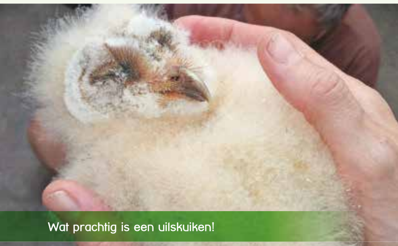
Wat prachtig is een uilskuiken!