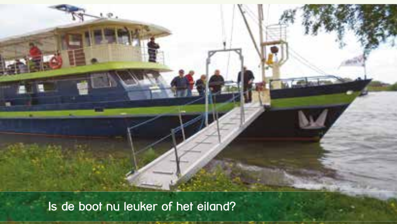
Is de boot nu leuker of het eiland?