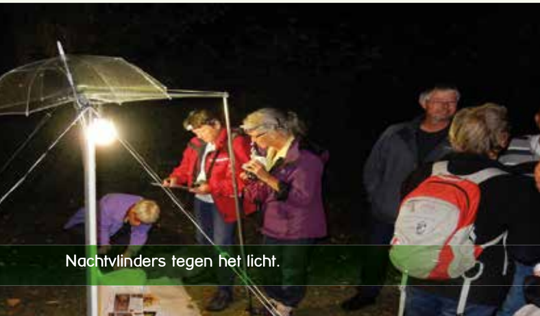
Nachtvlinders tegen het licht.