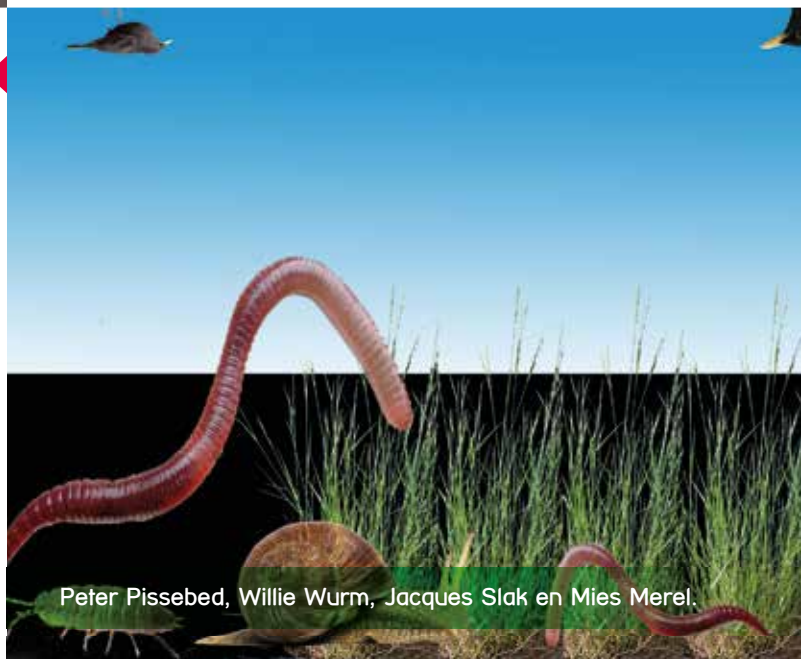
Peter Pissebed, Willie Wurm, Jacques Slak en Mies Merel.

Soms kan natuur of Duurzaamheid het onderwerp zijn van een kunstproject ontwikkeld en uitgevoerd door Kunst Centraal in Bunnik. Deze organisatie heeft prachtige lessen voor bijna alle scholen in de provincie Utrecht. Zo leren de kinderen op een kunstzinnige manier een slak, een worm en een pissebed te maken bij de lessenserie Willie Wurm zoekt een huis. De afsluiting is dan een buitenles, waarbij de kinderen op zoek gaan naar Willie Wurm, Jacques Slak en Peter Pissebed. Deze lessen worden gegeven in Nieuwegein, IJsselstein en Lopik. Ook organiseert Kunst Centraal op vraag van de scholen voor alle kinderen kunstzinnige lessen over afval in de gemeente Lopik. BuitenWijs draagt haar steentje bij in praktische lesideeën en materialen en ondersteuning samen met de Lopikse vrijwilligers. Zo krijgen alle basisschoolkinderen les over afval!