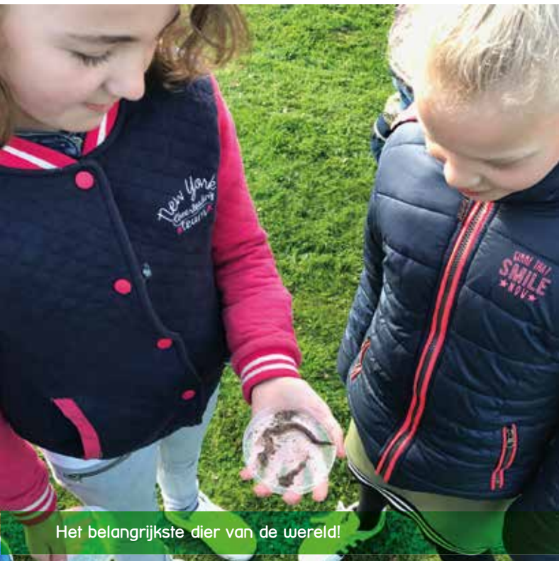
Het belangrijkste dier van de wereld!