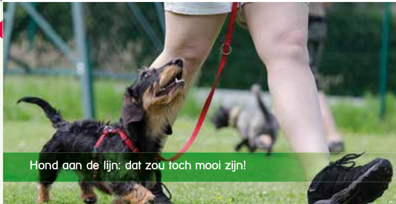
Hond aan de lijn: dat zou toch mooi zijn!

Dit nog jonge bos is onlangs bijna twee keer zo groot geworden, maar de jonge boompjes zijn natuurlijk niet snel groot. Ook zijn er in dit bos veel gebruikers. Steeds vaker hebben de kinderen tijdens de buitenlessen overlast van de loslopende honden. Samen met de IJsselsteinse vrijwilligers en SBB zijn er praktische oplossingen bedacht, zoals een nieuwe verzamelplek en een bord met de vraag de honden in het voorste deel van dit bos aan de lijn te laten.