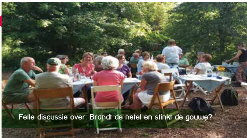
Felle discussie over: Brandt de netel en sinkt de gouwe?