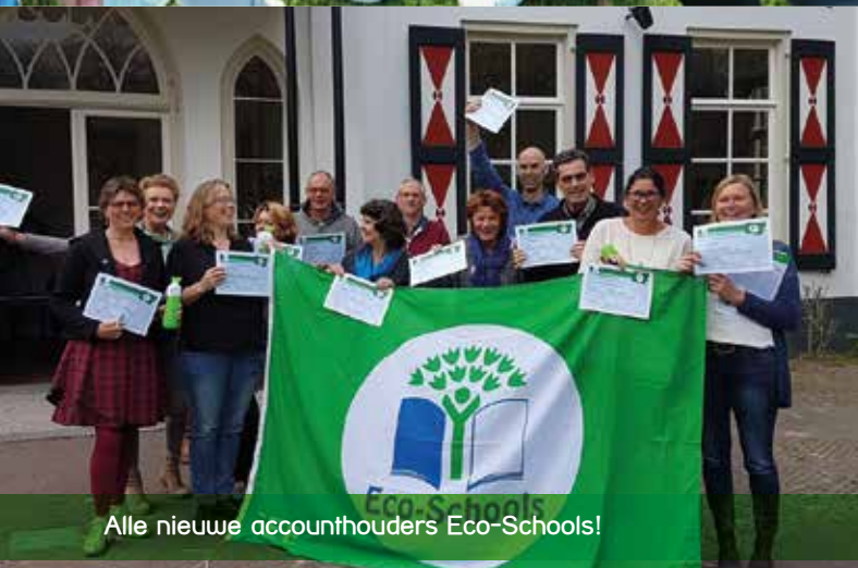
Alle nieuwe accounthouders Eco-Schools!

Dinsdag 11 april 2017 was de Nationale Buitenlesdag! Een buitenles is niet alleen goed voor de leerprestaties van kinderen, het is ook nog eens leuk! Daarom trakteerde BuitenWijs in elke gemeente een school met alle groepen kinderen op een buitenles. Onderwerp: het belangrijkste dier van de wereld! Welk dier is dit dan? Zonder dit dier is er geen goede bodem voor het gras, zodat de koeien geen voedsel hebben en melk kunnen geven. Dit dier beweegt zonder armen en benen, maar draagt wel een zadel. Het ademt door de huid heen en is zowel man als vrouw. Tsjja, naar zo'n bijzonder dier gingen alle kinderen op zoek en samen met de medewerkers van BuitenWijs ontdekten zij bijzondere eigenschappen van dit dier. En wat is er dan nog leuker om een wormarium voor dit dier te bouwen en er voor te zorgen! De kinderen trappelden als meeuwen om de wormen boven de grond te krijgen, zodat zij de wormen van top tot teen konden bekijken. Hoera voor de worm: het belangrijkste dier van de wereld!