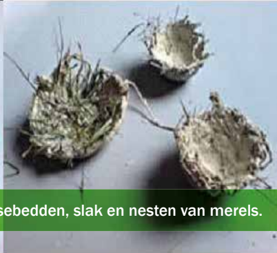
4 Werkstukken: wormen, pissebedden, slak en nesten van merels.