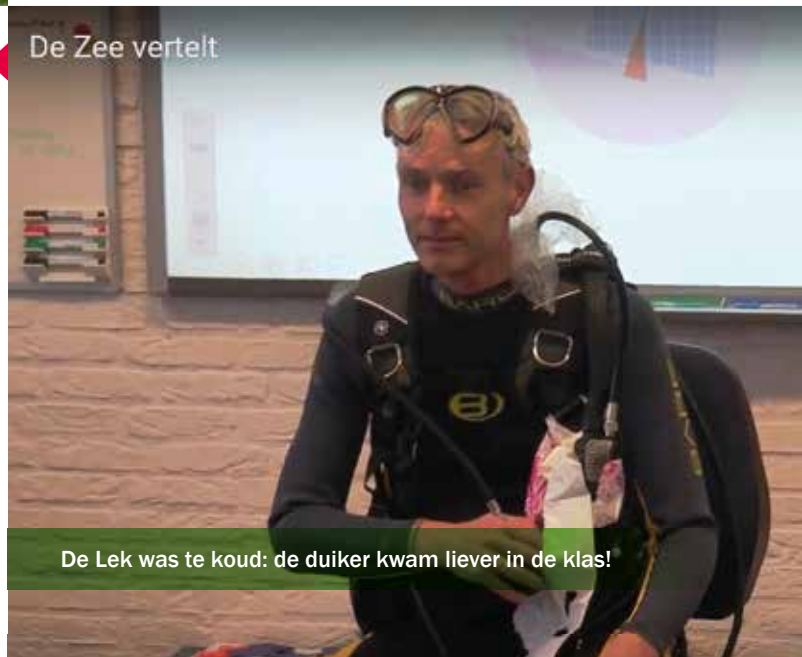
De Lek was te koud: de duiker kwam liever in de klas!